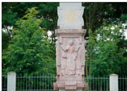
CIMITERO MILITARE ITALIANO