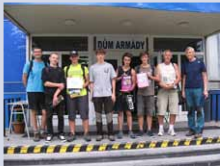
Foto: Vítězné družstvo ZŠ Husova Tábor

Vzhledem k pozitivním u ohlasu na střeleckou ligu ze strany žáků i pedagogického sboru budeme od podzimu a tedy nového školního roku připravovat vyhlášení střelecké ligy pro rok 2015.