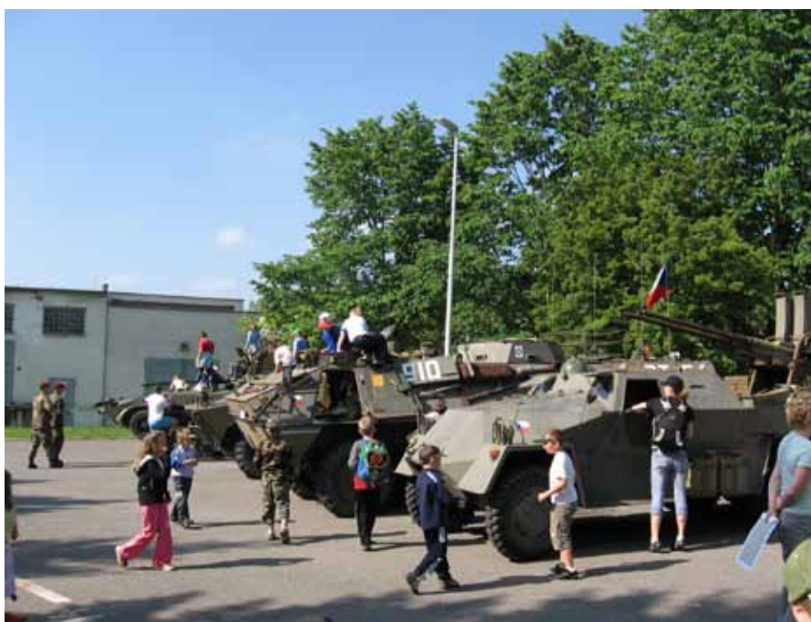
Historická bojová technika AČR veterán klubu při ukázkách na Dni dětí v posádce.

V příštím roce naše pobočka oslaví 15 let od svého založení. Bude to důvod k bilančování a rovněž k zamyšlení nad obsahem činnosti v dalších letech. Činnost pobočky pokračovala i přes citelný zásah do členské základny vyvolaný změnou dislokace velitelství operačního stupně i hrozbu zrušení tábořské posádky a doufáme že budeme i nadále v nových podmínkách uspokojovat zájmy členů a svými akcemi pomáhat propagovat armádu na veřejnosti.