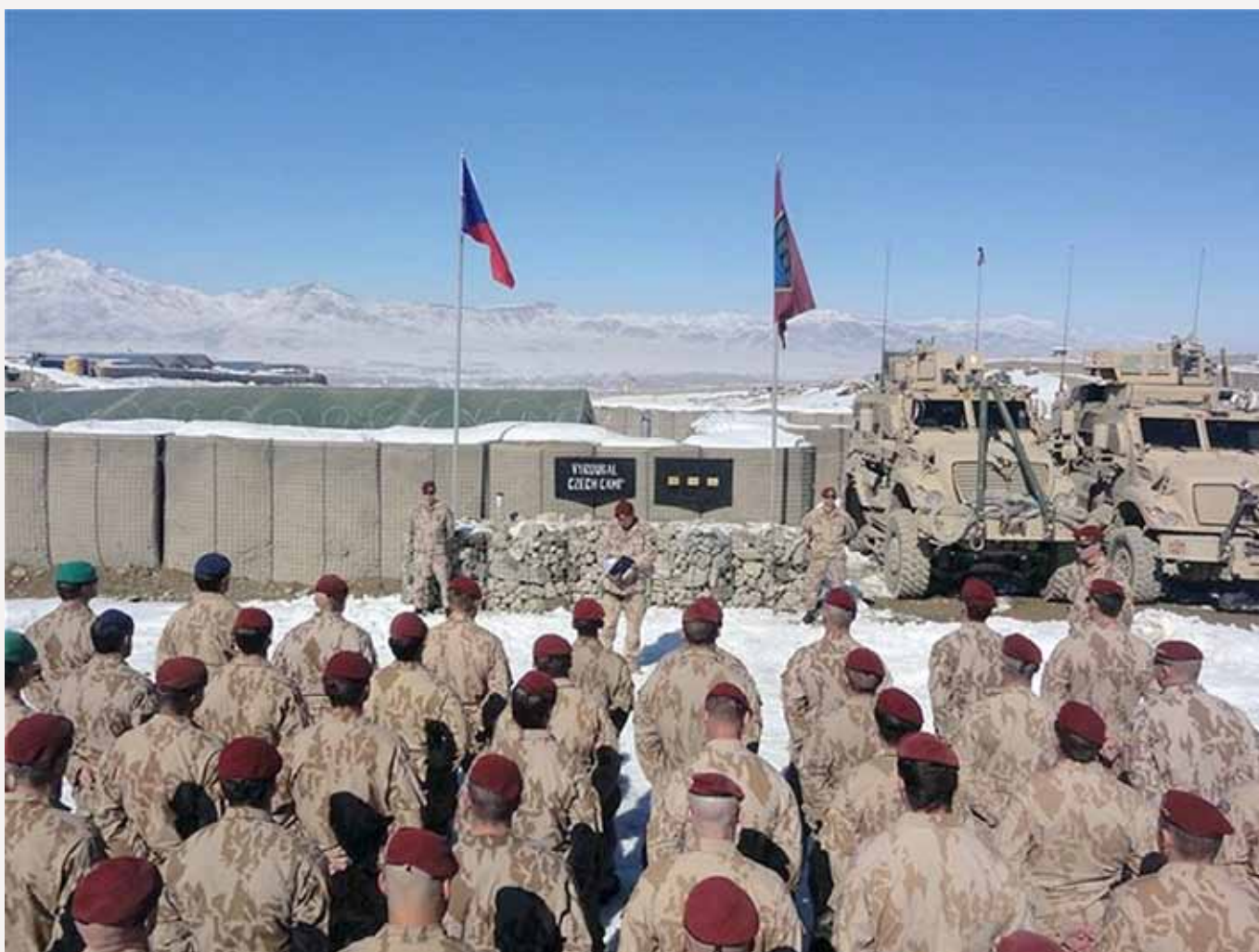
Čeští vojáci na misi NATO v Afghánistánu (ilustrační foto)