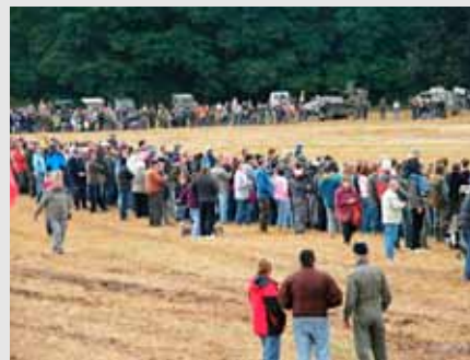
Historická vojenská technika na tábořském náměstí při závěrečném setkání Jízdy veteránů.