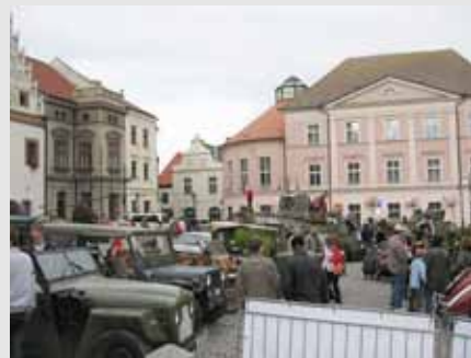
Jedna z ukázek historické bojové techniky na veřejnosti v obci Bernartice.